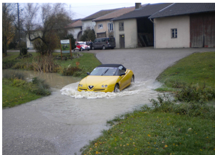
Le passage de Gué rendu spectaculaire par les conditions météo

L'arrivée de la 2 ème étape était également à Baccarat.