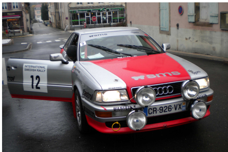
Prêt pour le départ

Café et brioche permettaient aux concurrents d'attendre leur tour aux formalités et surtout de faire connaissance ou de se retrouver et bien sur, parler voiture et météo.