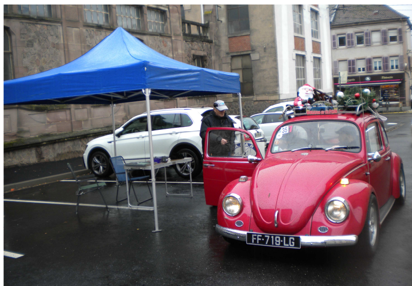
Au départ une coccinelle avec un air de Noël