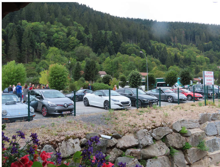
Sur le parking de la confiserie