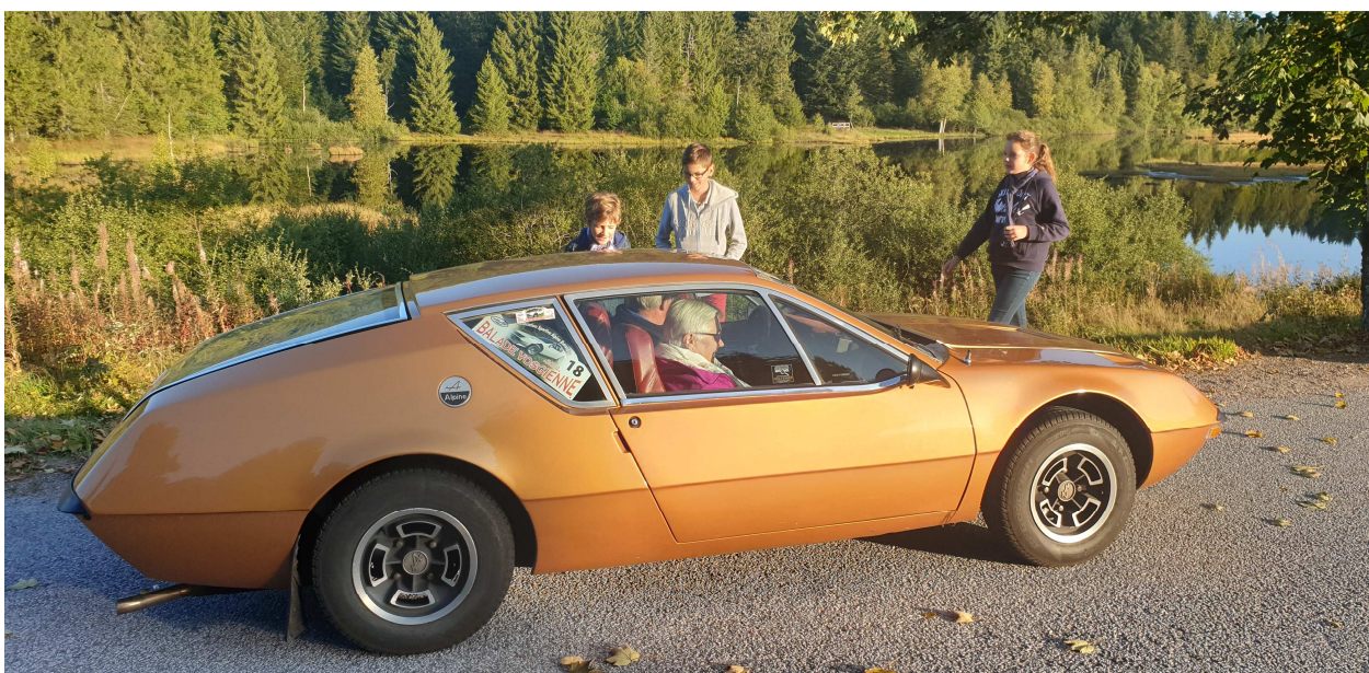
Au Bord du lac de Lispach

Cette année les concurrents quittent l'hôtel et se dirigent vers le lac de Lispach (une tourbière lacustre à 900 m d'altitude) où un photographe les attend pour la photo souvenir qui leur sera donnée pendant le repas de clôture le dimanche