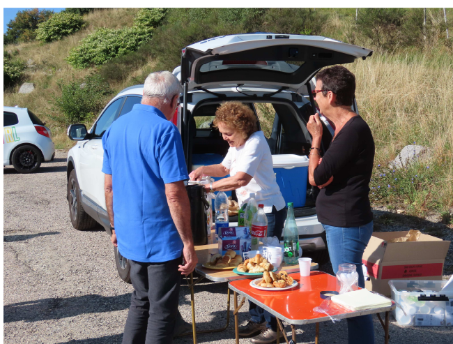
A la pause du matin au col des Bagenelles