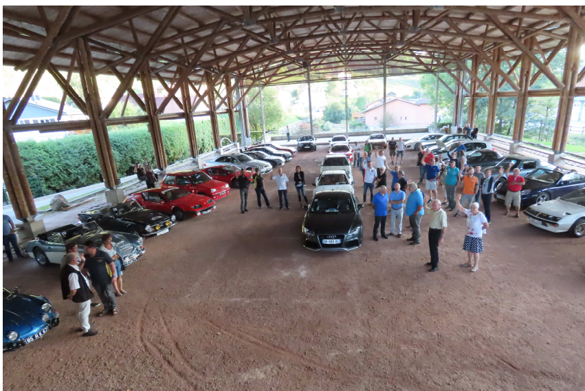
A la Halle patinoire

Cette année, l'adjointe au Maire attendait les concurrents à la Halle Patinoire où leurs belles voitures étaient exposées le temps des discours et de l'apéritif.