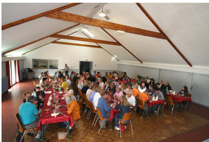
Devant la salle et repas à Bertrichamps