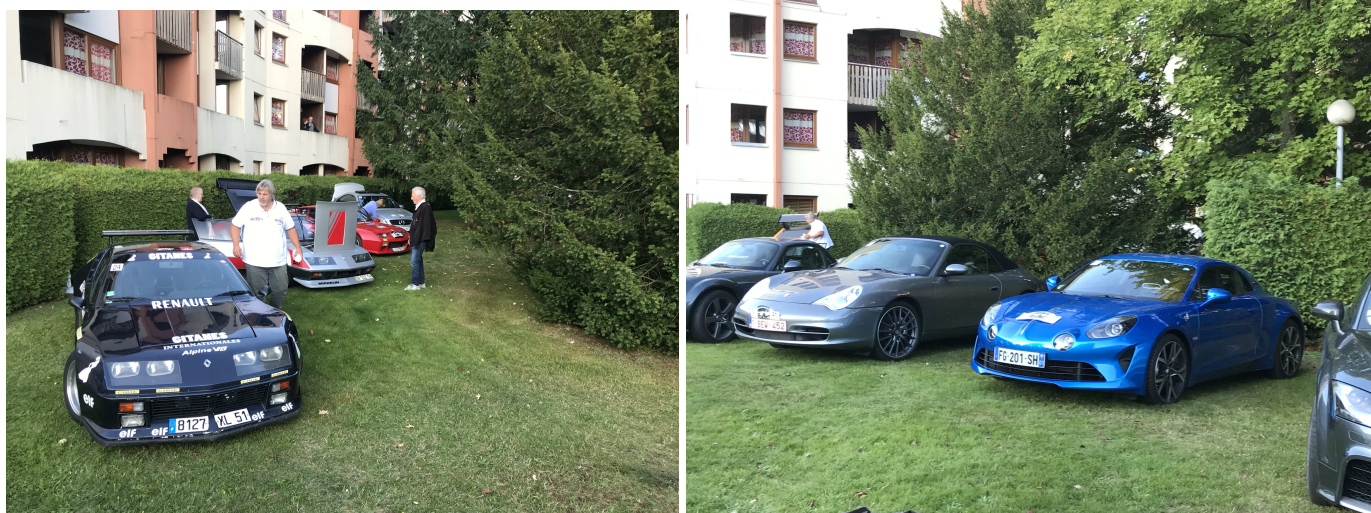
Les voitures garées dans le parc de l'Hôtel

A l'arrivée, les voitures furent rangées dans le parc de l'hôtel dans l'ordre des numéros afin de favoriser le départ du lendemain.